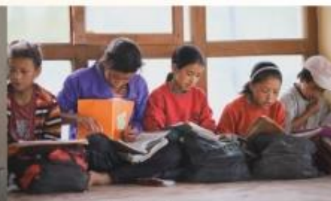
Les enfants étudient leur cours avec les manuels scolaires écrits en anglais.