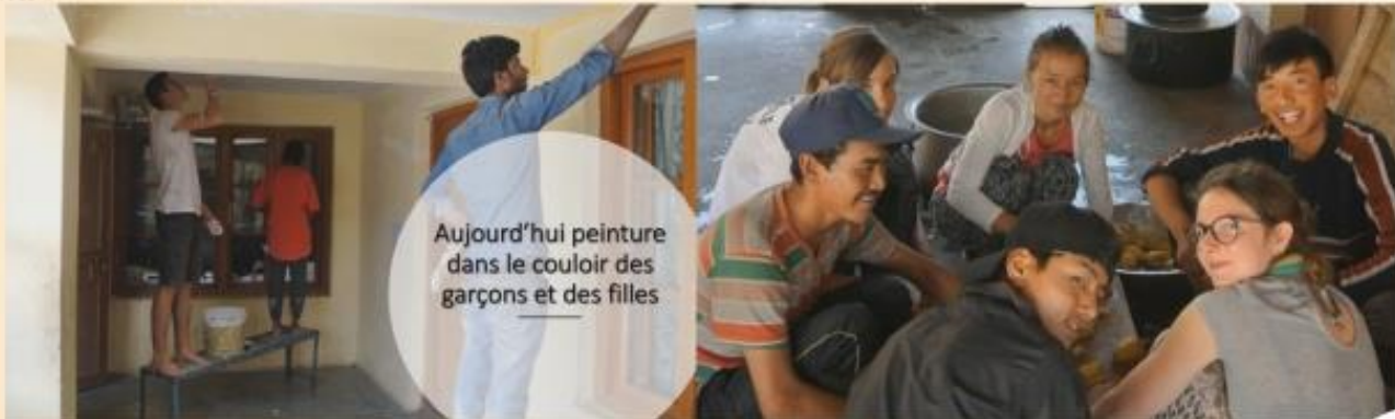
Aujourd'hui peinture dans le couloir des garçons et des filles