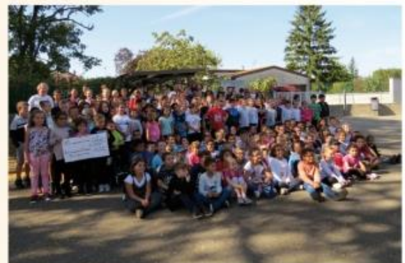
Remise d'un don par les classes primaires de Loyettes