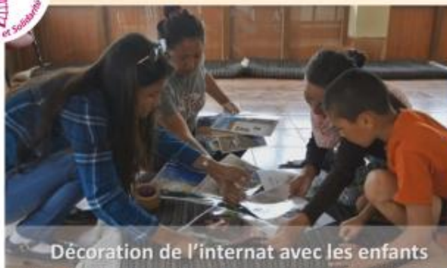
Décoration de l'internat avec les enfants