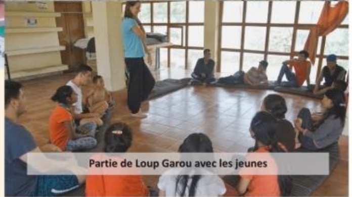
Partie de Loup Garou avec les jeunes