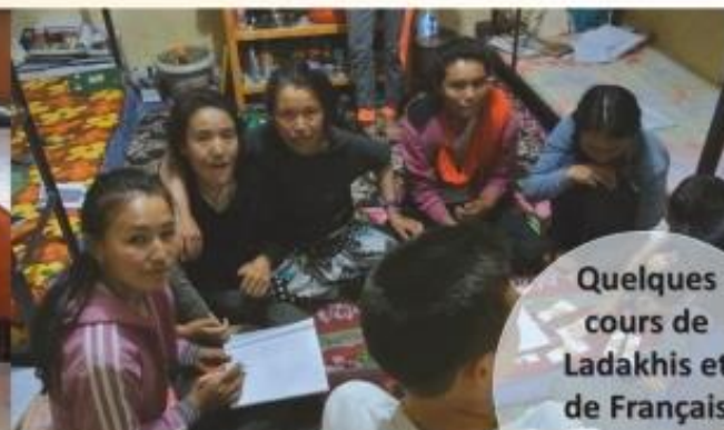
Quelques cours de Ladakhis et de Français