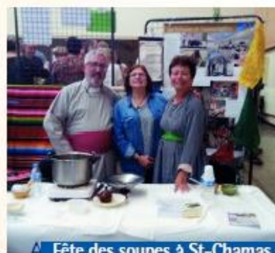
Fête des soupes à St-Chamas