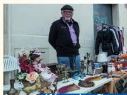
Vide-grenier à Chorges

7 décembre participation au téléthon à Chorges. 120 € ont été récoltés par la vente de la soupe tibétaine aux épinards.