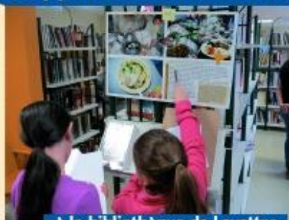
à la bibliothèque de Loyettes

Nous avons beaucoup de sympathisants dans notre secteur mais ne sommes que quelques adhérents. L'AG en Rhône-Alpes en 2020 devrait conforter les liens et faire progresser la participation à nos actions.