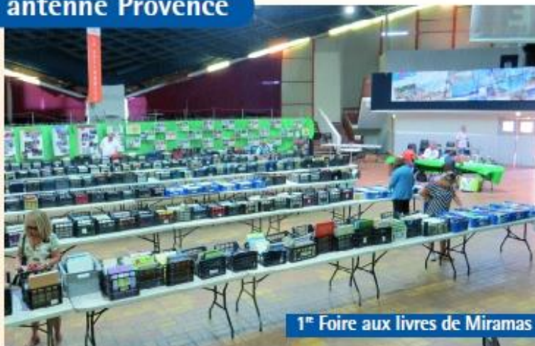
1 re Foire aux livres de Miramas

23 décembre mise à l'honneur, par le maire de Miramas de trois élèves de terminale du lycée de Fontlongue pour leur implication en faveur de La Cordée.