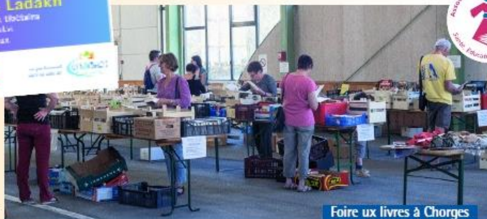
Foire aux livres à Chorges

21 et 22 avril a eu lieu la 4 ème Foire aux livres de Chorges. Un atelier de mandalas, un stand de produits artisanaux de l'Himalaya et des auteurs régionaux complétaient la vente des livres. Bilan : plus de 1000 livres vendus, des adhésions réalisées et une recette de plus de 1400 €. Cela grâce au travail des bénévoles (10 séances de tri de livres ont été réalisées !).