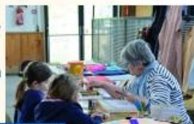
l'atelier de mandalas

Vente de livres, ateliers de mandalas et de calligraphie, présence d'auteurs avec dédicaces. Belle réussite avec en prime un bel élan de nouveaux bénévoles qui ont fait un super boulot ! une nouvelle adhésion à La Cordée. La tombola a été l'occasion de recueillir une centaine de nouveaux noms et adresses dont près de la moitié ont aussi indiqué leur e-mail ! Recette globale : 1402,50 € répartie en : • 789 livres pour 819 € • 17 articles artisanaux pour 235 € • 14 dons anonymes pour 229,50 € • 119 billets de tombola pour 119 €