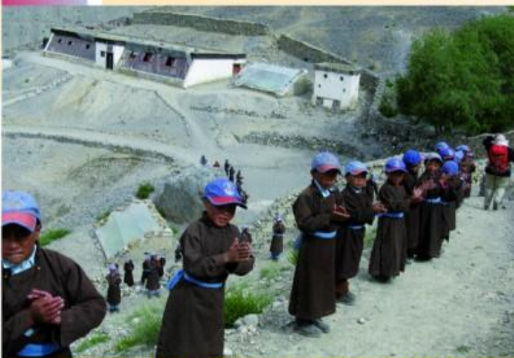
Accueil de membres de La Cordée à Lingshed (photo d'archives 2010)